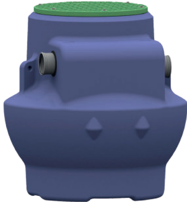
Sanigrease SU 1

Les Sanigrease SU 1/1.5/2/3/4 sont des séparateurs à graisses conçus pour être enterrés. Disponibles en plusieurs formats avec une Taille Nominale de 1 à 4 (TN), ils sont en polyéthylène recyclable réalisés par rotomoulage. Ce sont des modèles avec débourbeur pour récupérer les matières lourdes et sont munis de dispositifs d'entrée et de sortie en PVC. Enfin le couvercle avec joint étanchéité pour passage piéton est verrouillé par une visserie inox et est en composite armé