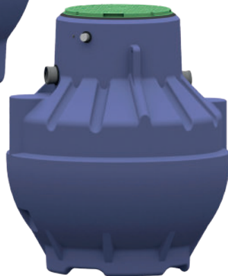
Sanigrease SU 1.5/2/3/4